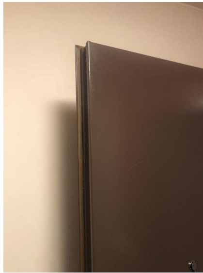
P-list på dörren