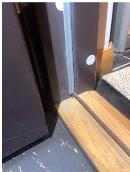
O-list i dörrkarm och P-list vid tröskel.