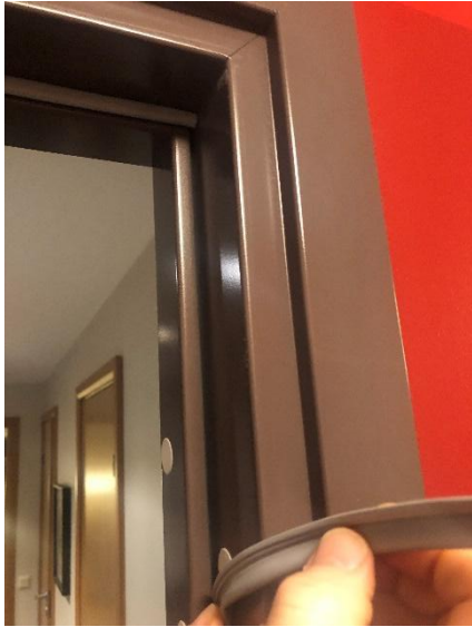
O-list och springan i dörrkarmen