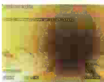
Utseende normalt rör